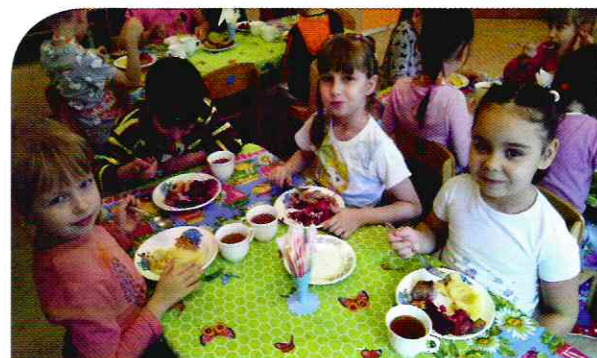
Любим есть овощи

В итоге проведения данного проекта дети не только многое узнали про свойства и качества овощей, но и узнали об их пользе и, что не маловажно, стали с большим желанием есть овощные блюда.