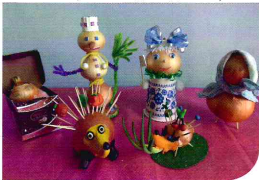
Поделки из лука

Открытием дня для взрослых и маленьких учёных становится информация о том, что с закрытыми глазами и носом практически невозможно определить, ешь ли ты лук или другой овощ.